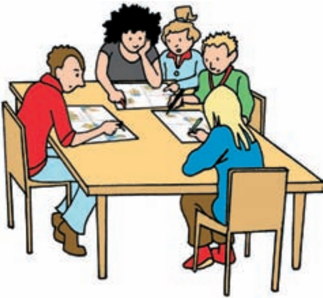
Kinderen evalueren met het evaluatieraster.